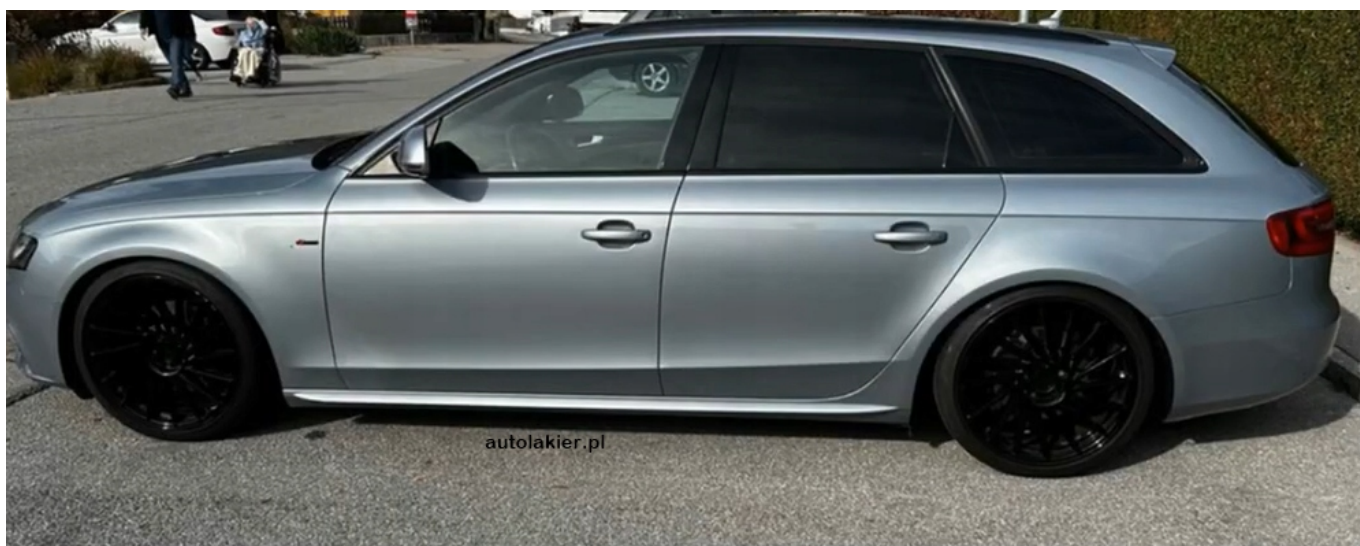
LX7V Monzasilber Metallic