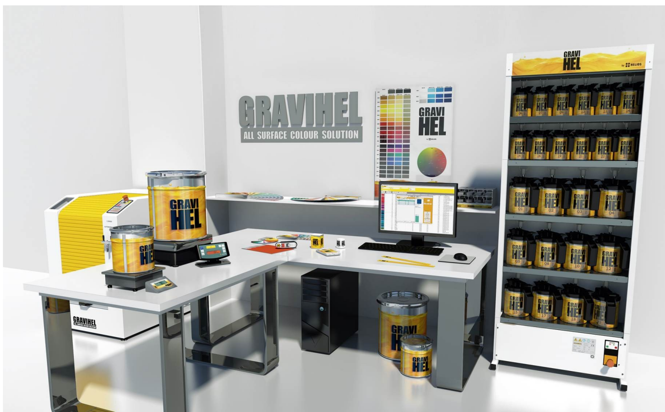
GraviHEL to profesjonalny system wiążący do mieszanin dla drobnego rzemiosła, składający się z 23 uniwersalnych past (3