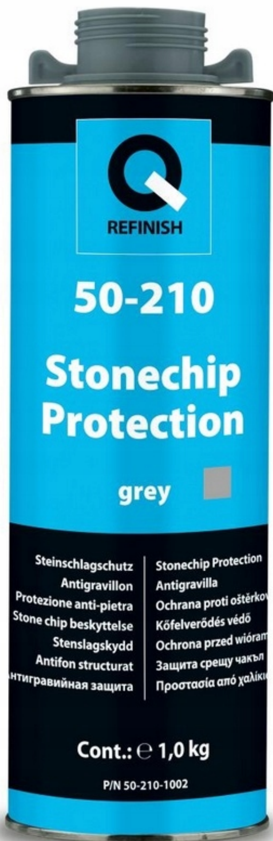
Q-REFINISK 50-210 wzmocniona konserwacja