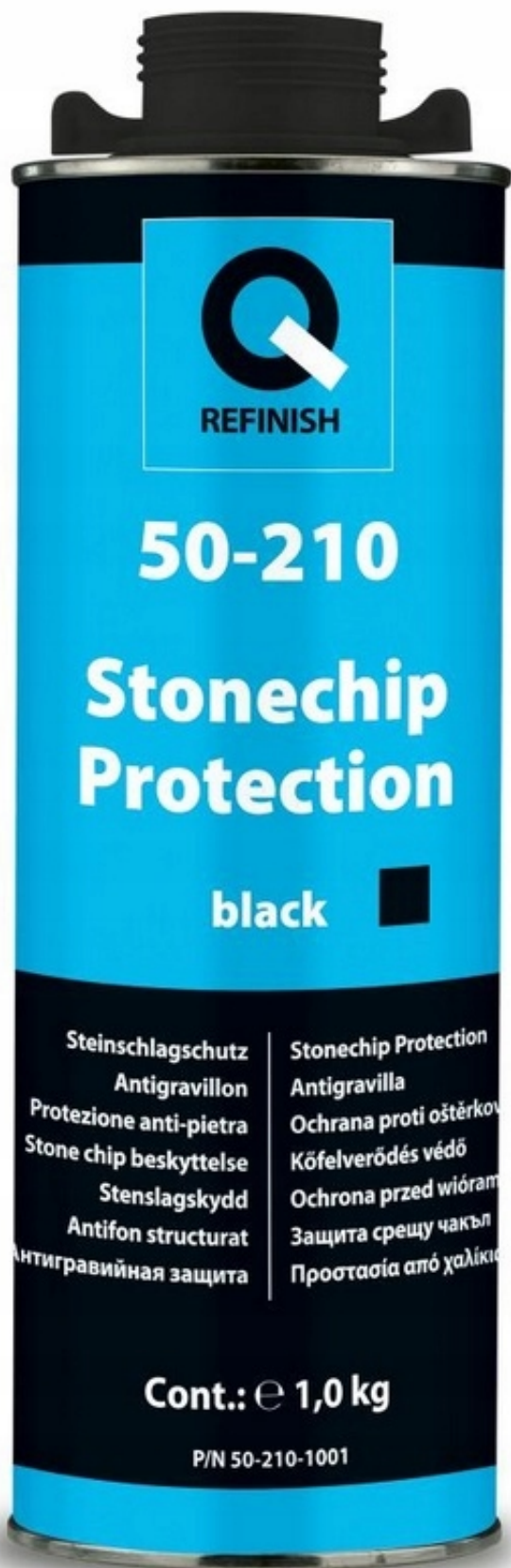
Q-REFINISK 50-210 wzmocniona konserwacja