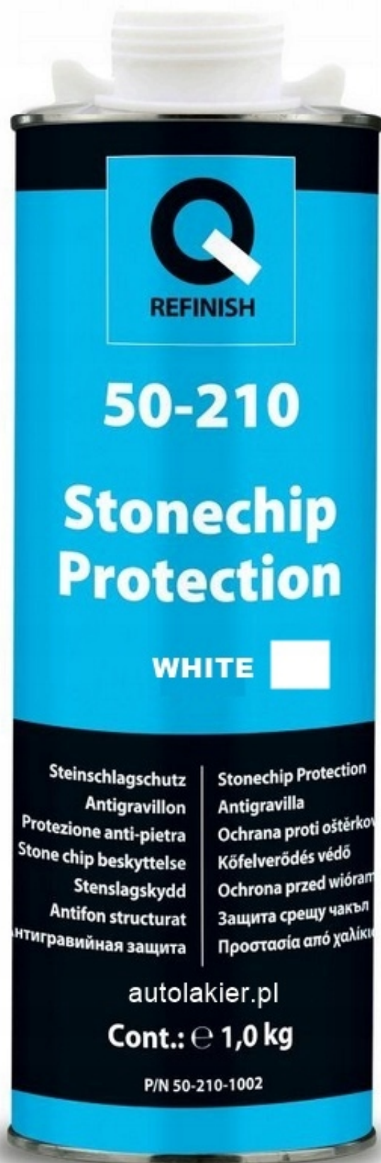
Q-REFINISK 50-210 wzmocniona konserwacja