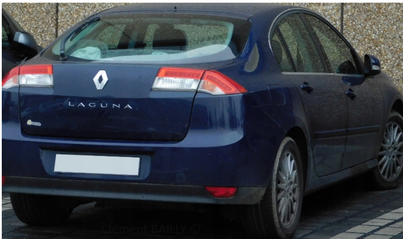
Clément BAILLY ©