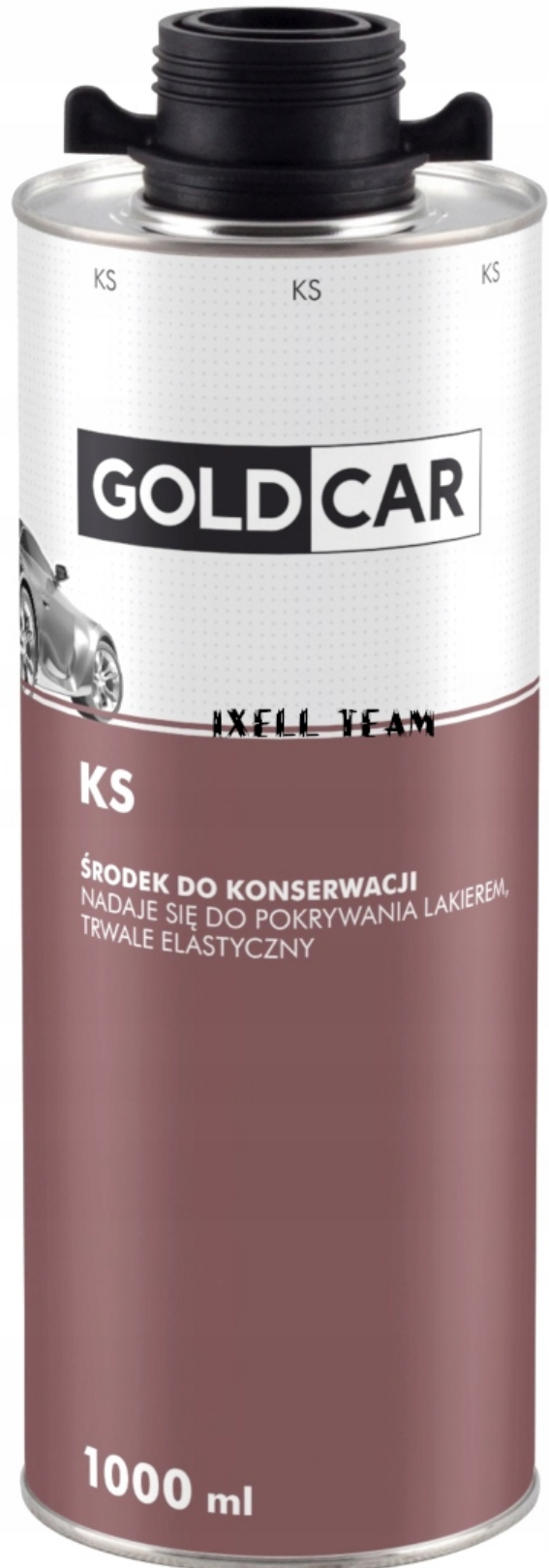
GOLDCAR CSV RM ŚRODEK DO KONSERWACJI